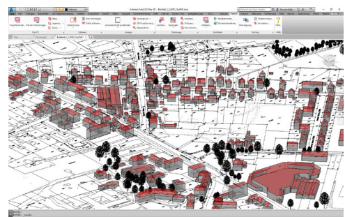
Importierte CityGML-Gebäude in WS LANDCAD